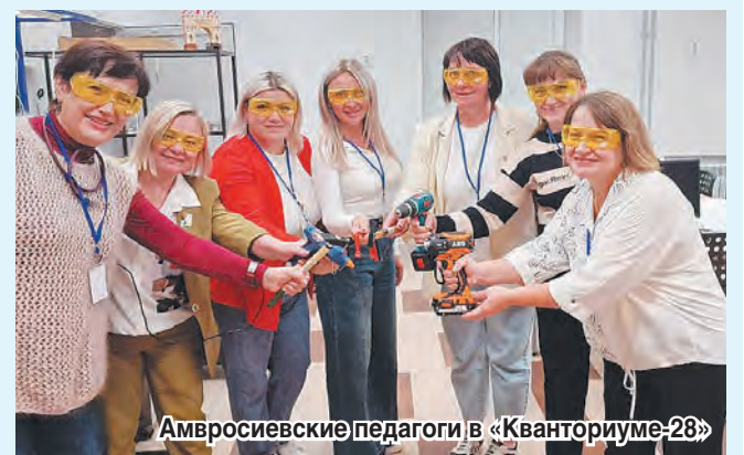
Амвросиевские педагоги в «Кванториуме-28»