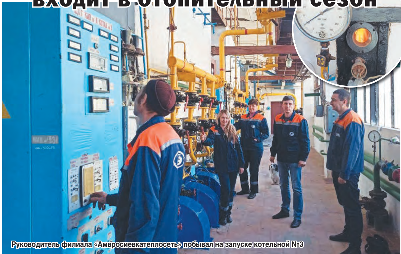
Руководитель филиала «Амвросиевкатеплосеть» побывал на запуске котельной №3

В последнее время наш народ уже привык к различным погодным сюрпризам: весна наступает летом, жара, как правило, бывает в сентябре, и вот, пожалуйста, в октябре резко похолодало, да так, что народ из сланцев сразу переболел в сапоги. Возможно, осень и вспомнит о том, что пропустила свою очередь в смене времён года, но сейчас она где-то задержалась и заставила людей думать не о приятной золотой поре бабьего лета, а о тёплых батареях в квартирах и учреждениях. Да и перед властями поставила вопрос: начинать отопительный сезон или подождать?